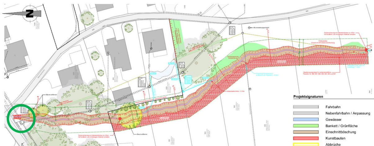
Abbildung 2: Ausschnitt Ausführungsplan HWS Wannemoosbach (Stand 27.08.2025, CES AG)

Der Gemeinderat bittet die Bevölkerung um Verständnis für mögliche Behinderungen oder Emissionen während der Bauzeit und dankt herzlich für die Unterstützung.