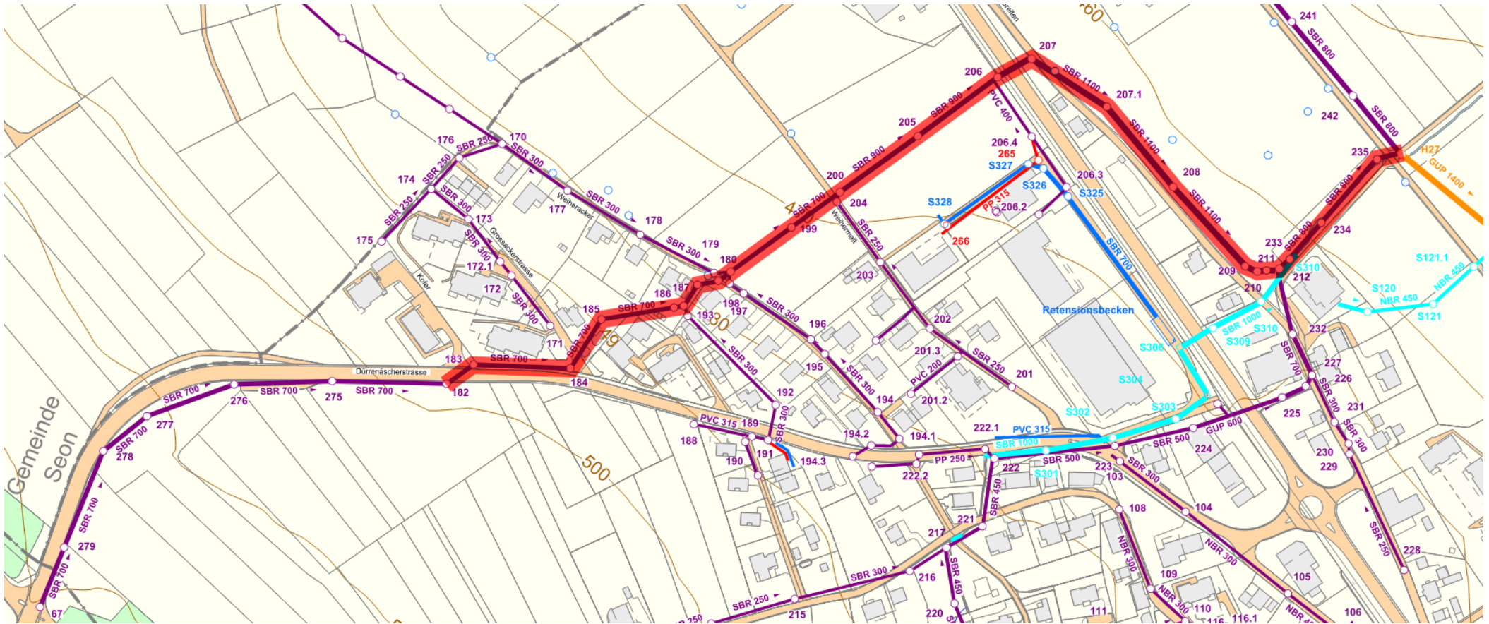
Übersicht über den zu sanierenden Leitungsabschnitt